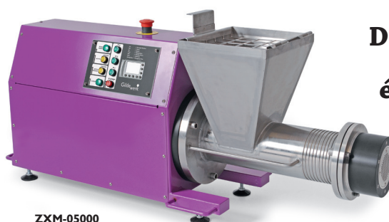
ZXM-05000 1500 Watt extruder

Vous connaissez déjà notre machine à savon ZXM-05000 de couleur violette, un modèle de qualité de 1500 Watts. Avec son coffrage au design soigné, elle est équipée d'une commande par PLC et d'une roue hélicoïdale en bronze. Le PLC (système de commande informatisé) gère la procédure pour vous. Il indique quand la machine est parvenue à la température d'utilisation et permet d'effectuer tous les réglages voulus. La machine peut même effectuer un auto-diagnostic pour vous indiquer si tout fonctionne correctement. Tout le monde n'a pas besoin de telles possibilités, c'est pourquoi nous avons ajouté deux modèles plus sobres de machines à savon à notre assortiment: la ZXM-07000 de 1500 Watts, et la ZXM-07050 de 2200 Watts. Nous avons aussi réduit au minimum les dispositifs électroniques et le coffrage est plus sobre. Restent des machines de travail robustes. Naturellement, nous n'avons fait aucune concession en matière de sécurité. La roue hélicoïdale est aussi en bronze.