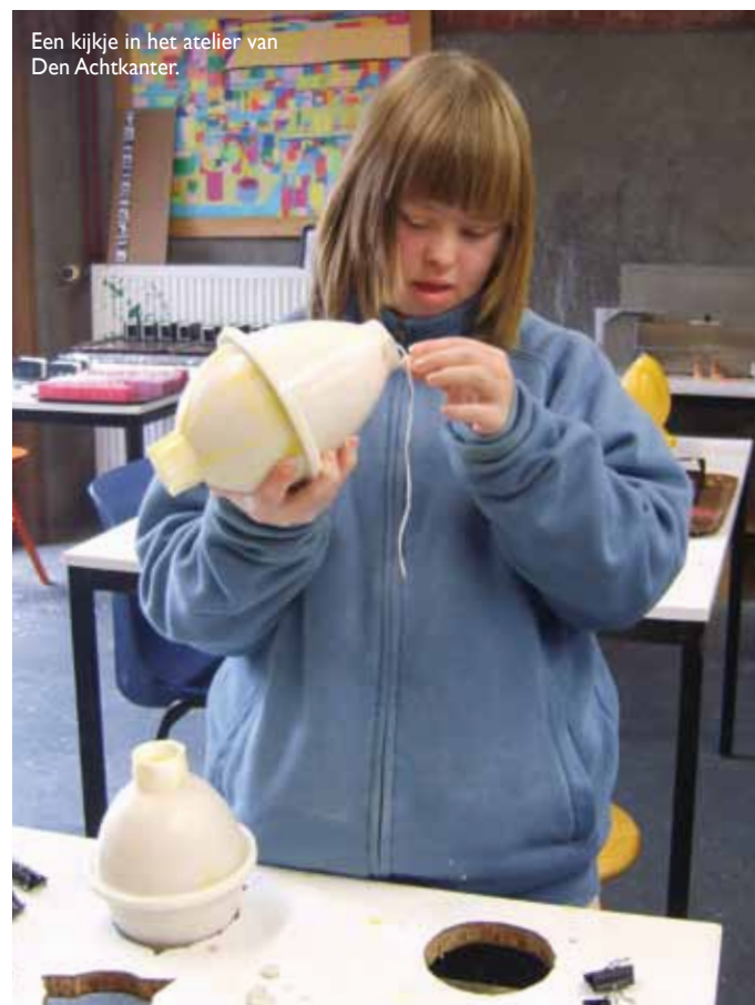
Een kijkje in het atelier van Den Achtkanter.

Gildewerk Frankrijk: Gildewerk France s.a.r.l. ZA Quartier Charponnet 26400 Allex sur Drôme t: + 33-(0)475 62 80 31 f: + 33-(0)475 62 80 29 e: france@gildewerk.com