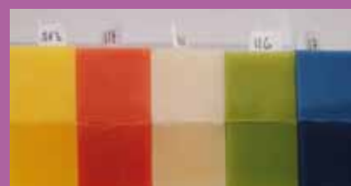
Variaties in transparantie. De bovenste rij is het minst transparant.

der de kleur. Dit biedt in creatief opzicht tal van mogelijkheden, omdat door van wassoort te wisselen allerlei kleurnuances kunnen worden gecreëerd. Gerangschikt van meest tot minst transparant zijn: transparante was, dompelwas (A), T119, gietwas, T119 + stearine, gietwas + stearine en gietmix”